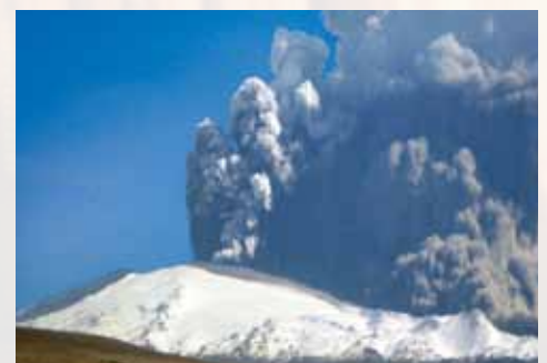
Les Islandais – un peuple qui affronte courageusement une Nature dont la force redoutable se révèle brutalement quand l'un des nombreux volcans se réveille pour déchirer le silence du froid des glaciers...