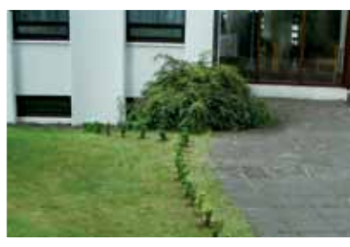
Le comité a planté des buis devant l'évêché à Reykjavik en signe de soutien et de solidarité.