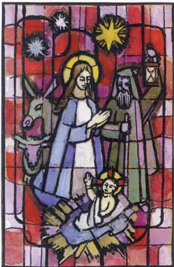
La Chapelle de Villa s/Evolène. La Nativité. J. Prahin 2008