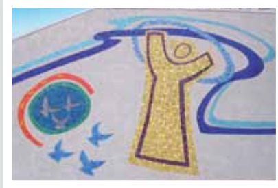
La sainte Vierge Marie, exemple parfait de Foi, d'Espérance et de Charité...