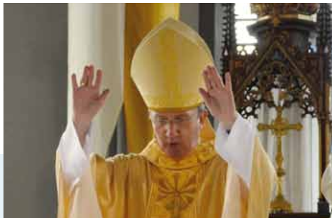
La Bénédiction Pascale retentit dans le monde entier, également à Reykjavik!