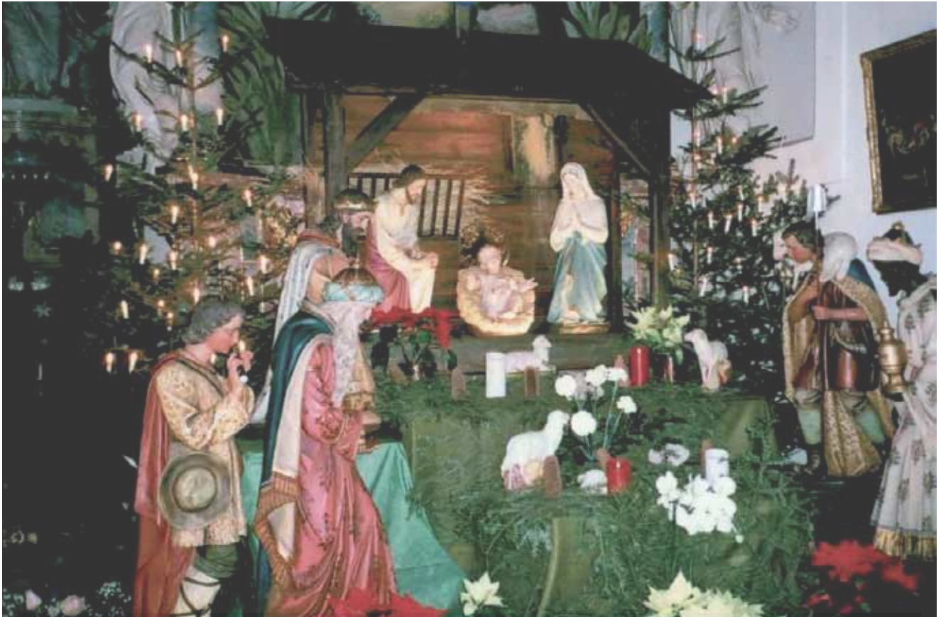
Crèche de l'église des Dominicaines contemplatives du Monastère St. Peter am Bach, Schwyz. Les personnages principaux de cette crèche fêtent en 2016 leur centenaire.

Béthléem - Jérusalem Noël 2016 Noël Au 2017